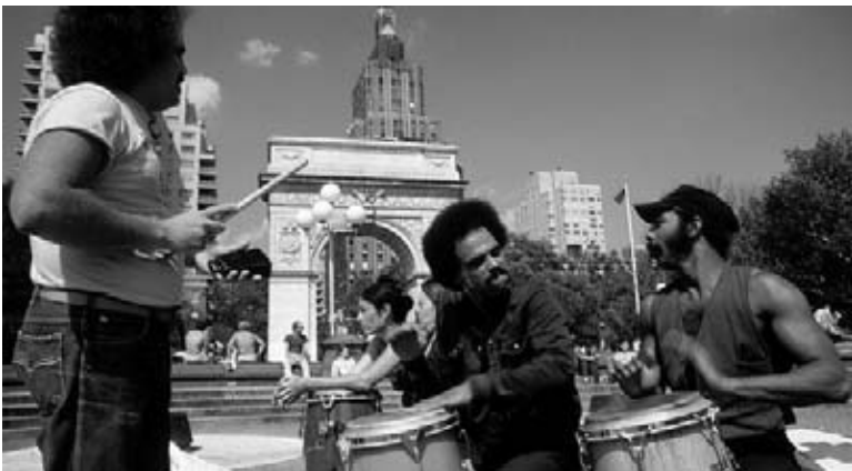
Les artistes de rue sont encore fréquents dans les rues de New York.

Pendant son adolescence, Ella a vécu dans la rue. Elle s'est efforcée de gagner sa vie en obtenant des pourboires en chantant et dansant dans une partie d'Harlem connue sous le nom de « Black Broadway ». Là, toutes sortes de spectacles de rue étaient présentés.