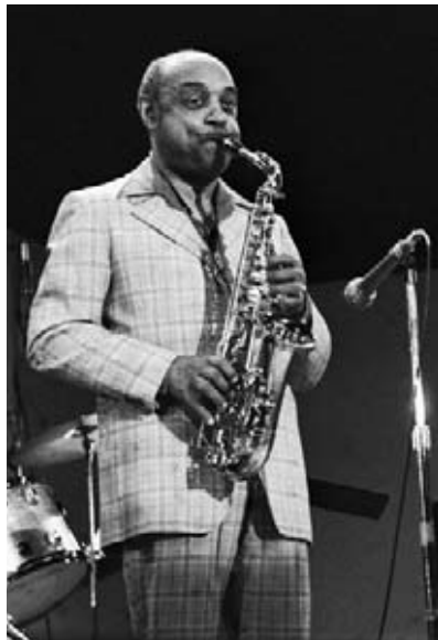
Benny Carter joue de son saxophone.

Reprenant à nouveau place au centre de la scène, Ella se racla la gorge alors que la musique commençait. Étant encore nerveuse, sa voix se brisa à la toute première note. Le public laissa échapper un murmure de mécontentement collectif et commença à huer et à lui crier de quitter la scène. Le cœur d'Ella battait si rapidement qu'elle crut qu'il allait exploser.