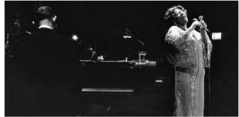
Ella pouvait faire des choses surprenantes avec sa voix extraordinaire.

Ella ne se laissa pas décontenancer par ce type de comportement. Elle aimait partager sa musique avec tout le monde. Elle avait, et a encore, des admirateurs de toutes les races, de tous les âges et de tous les milieux. Elle surmonta l'adversité et la bigoterie de la même façon qu'elle surmonta les difficultés de sa jeunesse.