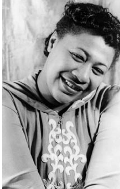
Ella Fitzgerald étant jeune.