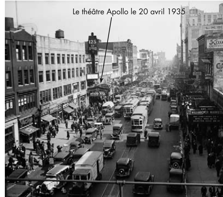
La carrière artistique d'Ella débuta au théâtre Apollo.