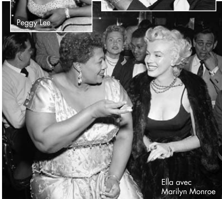
Ella avec Marilyn Monroe