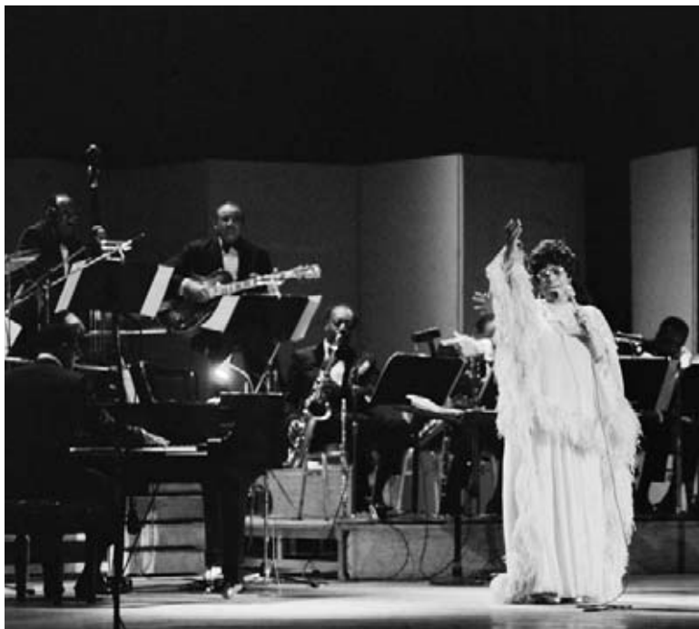
Ella se produit avec l'orchestre de Chick Webb.