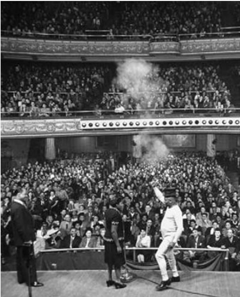
L'intérieur du théâtre Apollo.

Avant qu'elle ne puisse répondre, il lui tourna le dos et fit signe à son orchestre de jouer The Object of My Affection (L'Objet de mon Affection). Sans manquer une mesure et avec un sourire fendu jusqu'aux oreilles, Ella recommença à chanter.