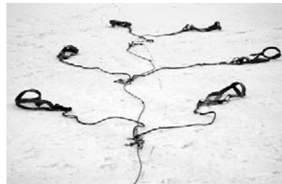
Le musher aligne les harnais et les prépare pour les chiens.