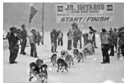
Un attelage prend le départ !

Alors qu'ils attendent le signal de départ, chaque musher se tient sur le frein, une pédale qui fonctionne comme les freins d'une voiture. De façon à bien retenir le traîneau en place, le musher installe une ancre à neige qui agit comme un frein d'urgence. Les deux s'agrippent à la neige pour empêcher le traîneau de bouger. Quand les mushers entendent le signal de départ, ils relâchent le frein et tirent sur l'ancre. Les chiens glapissent et jappent alors qu'ils s'efforcent de tirer le traîneau vers