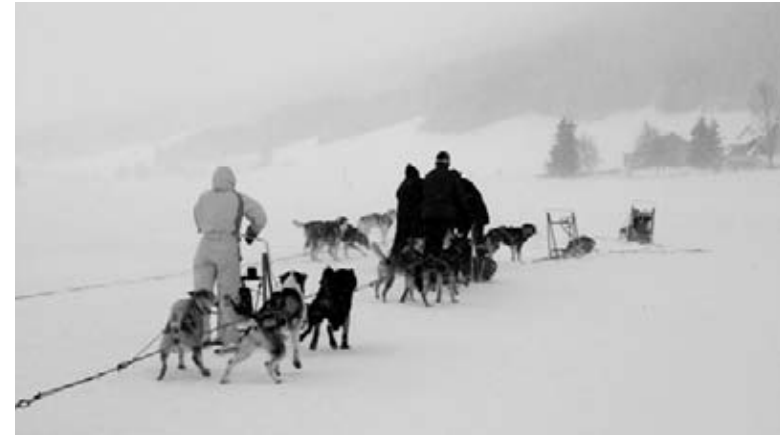
Un attelage est sur le point d'en dépasser un autre.