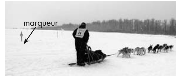
Les marqueurs aident les mushers à rester sur le sentier.

Même si les chiens ont été entraînés pendant des années, la course est très difficile. C'est la responsabilité des mushers de s'assurer que les chiens demeurent sur le sentier. Les mushers