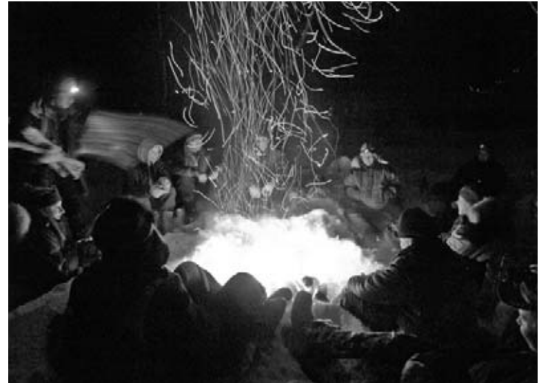
Les mushers partagent des liens d'amitié pendant les escales.