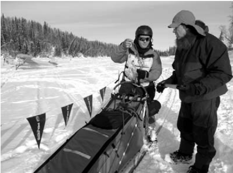
Un musher passe par un poste de contrôle.

De temps à autre, les mushers s'arrêtent à des postes de contrôle ou des stations le long du sentier où des adultes, appelés contrôleurs, s'assurent que les mushers sont en santé et qu'ils ont suffisamment de provisions. Des vétérinaires, aux postes de contrôle, s'assurent que les chiens sont en bonne santé. Les mushers ont aussi leurs propres routines à suivre aux postes de contrôle. Ils inspectent les bottines des chiens et font le tour des traîneaux pour s'assurer que toutes les laisses et les harnais sont en bonne condition. Ils vérifient aussi leurs blousons, leurs gants et leurs chapeaux, les remplaçant s'ils sont mouillés ou déchirés. Les mushers et les chiens passent seulement le temps nécessaire aux postes de contrôle, regagnant avec impatience le sentier pour continuer la course.