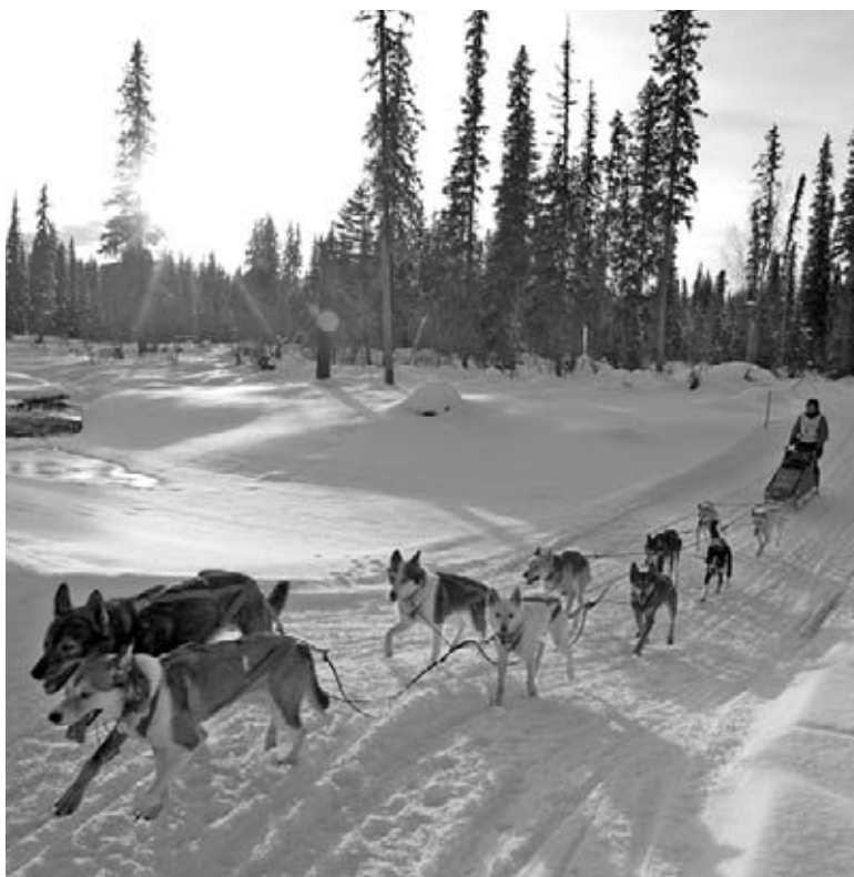
Les mushers et leurs chiens sont souvent les seuls êtres vivants le long du sentier.

Après dix heures, le musher en première place retourne sur son traîneau et quittent Yentna Station à la course. Les autres mushers suivent dans l'ordre dans lequel ils sont arrivés. Après avoir quitté Yentna Station, les mushers reprennent la course vers le point de départ en parcourant la même piste qu'ils ont suivie à l'allée. Ils passent par chacun des même postes de contrôle auxquels ils se sont arrêtés en route vers Yentna Station.