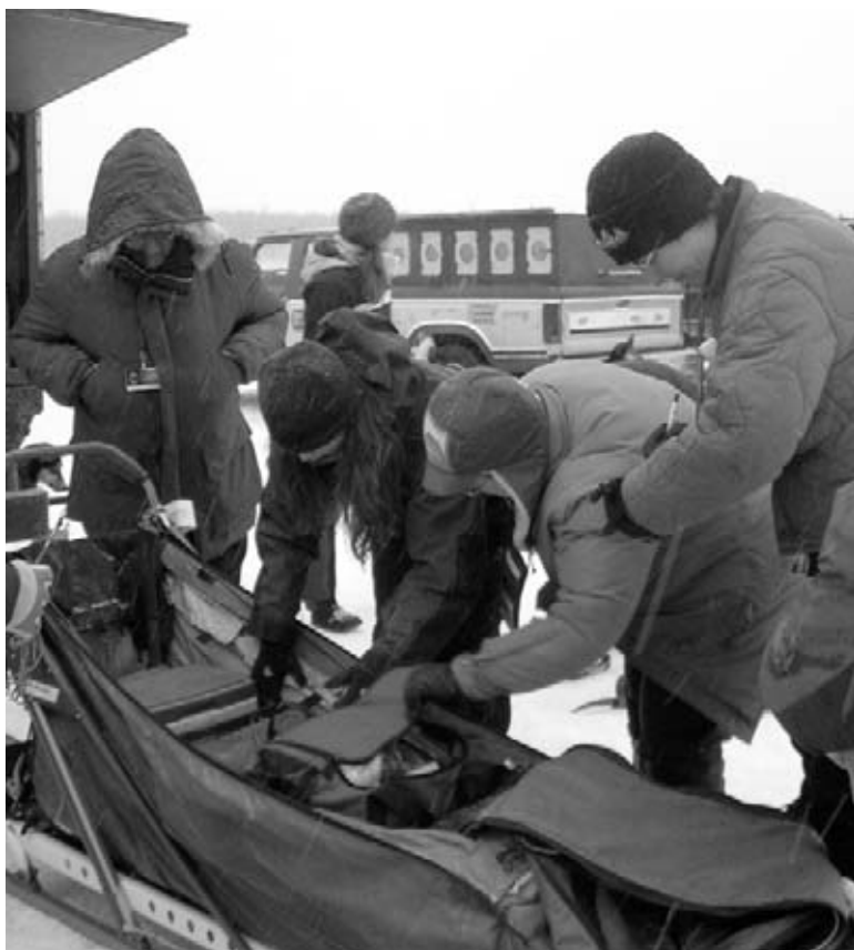
En train de vérifier les provisions sur le traîneau d'un musher.

Les adultes sur les lieux de la course ont une liste de contrôle des provisions nécessaires, appelée charge utile, que chaque musher doit transporter. Ces adultes s'assurent que les mushers ont empaqueté soigneusement et en toute sécurité, à l'intérieur des traîneaux, tout ce qui se trouve sur la liste de contrôle. Parce que la course est vraiment difficile, il est crucial que rien ne se perde ou devienne mouillé pendant la course. Après que l'enregistrement soit complété, chaque musher revêt un dossard avec son numéro officiel pour la course.