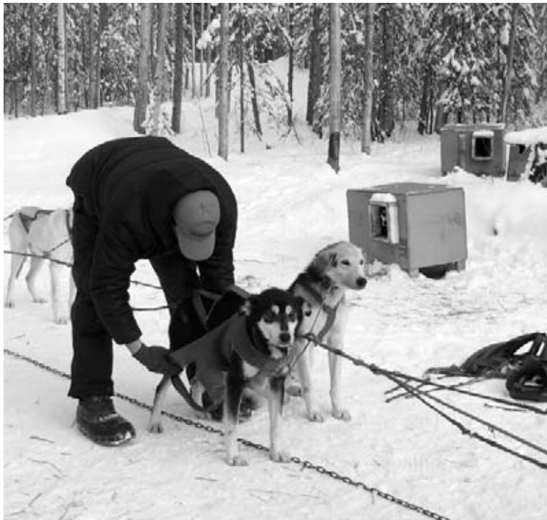
Aligner les chiens

Lors de chaque pratique, le mushers place différents chiens à l'avant, dans la position de tête, puis surveille attentivement pour voir comment l'attelage performe. Le jour suivant, le musher change les chiens de place et essaie quelque chose de différent. Après un certain temps, le musher trouve l'arrangement parfait qui permet aux chiens de travailler ensemble sans problème et de courir aussi vite que possible. Le chien de tête se tient à l'avant et les autres chiens s'alignent derrière en double file. L'attelage pratique ce même arrangement tous les jours jusqu'au jour du Junior Iditarod.