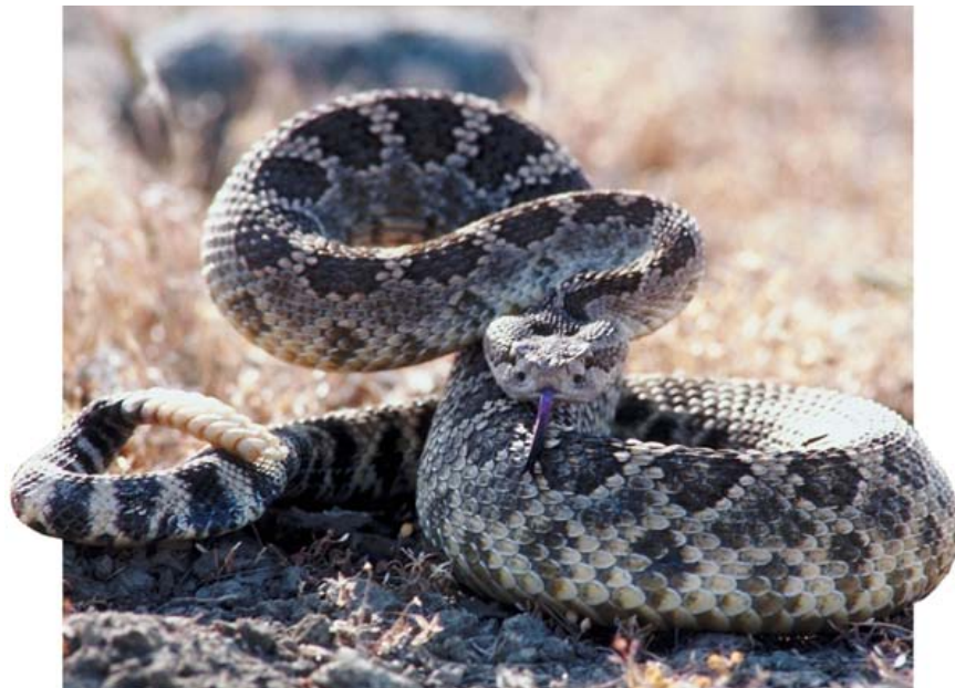
Un crotale atroce

Jude : Il n'est pas facile d'exclure immédiatement une morsure de serpent à sonnette parce que la maladie se manifeste par étapes. Elle commence par une marque de perforation souvent accompagnée de saignements. Ensuite, l'endroit de la morsure commence à enfler et à se décolorer. Quelques heures plus tard, il arrive que des ampoules se forment au niveau de la peau. Une destruction des tissus peut s'ensuivre, ce qui signifie que la peau et le tissu des muscles sont en train de mourir autour de la morsure.