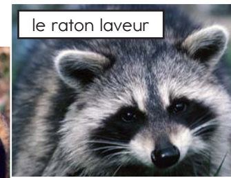
le raton laveur