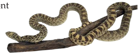
une couleuvre à nez mince

Jude : Il y a beaucoup plus de serpents non venimeux que de serpents venimeux. Plusieurs des serpents que nous appelons non venimeux ont en fait du venin, mais une morsure ne présente pas un danger grave pour la santé. Une morsure peut être douloureuse et il peut arriver qu'il se forme des ampoules ou une enflure au niveau de la morsure, mais rien de sérieux. On estime à plus de 35 000 le nombre de morsures chaque année aux États-Unis et de 6 000 à 8 000 d'entre elles sont venimeuses.