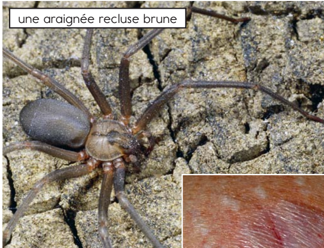
une araignée recluse brune