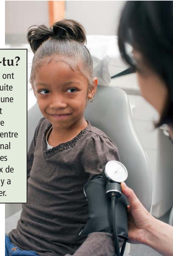
Un médecin vérifie la pression sanguine d'une petite fille.

Les gens qui ont des problèmes suite à une piqûre ou une morsure peuvent appeler un centre antipoison. Un centre antipoison régional est au courant des sortes d'animaux de la région dont il y a lieu de s'inquiéter.