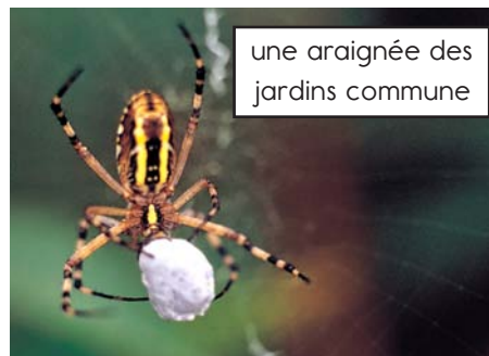
une araignée des jardins commune

La plupart des araignées sont inoffensives pour les humains. Certaines se nourrissent de pestes communes comme les mouches domestiques et les moustiques.