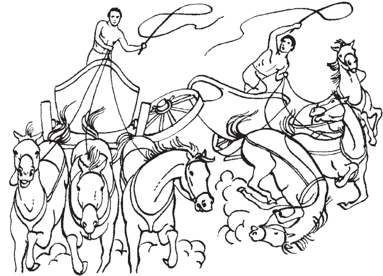
Les courses de chars étaient violentes; certains athlètes perdaient la vie durant la course.

En 776 av. J.-C., les gens d'Olympie, en Grèce, ont créé les premiers Jeux Olympiques. Les meilleurs athlètes de toutes les Cité-États se rassemblaient pour participer à des compétitions. Les Jeux faisaient honneur à Zeus, le roi de tous les dieux grecs.