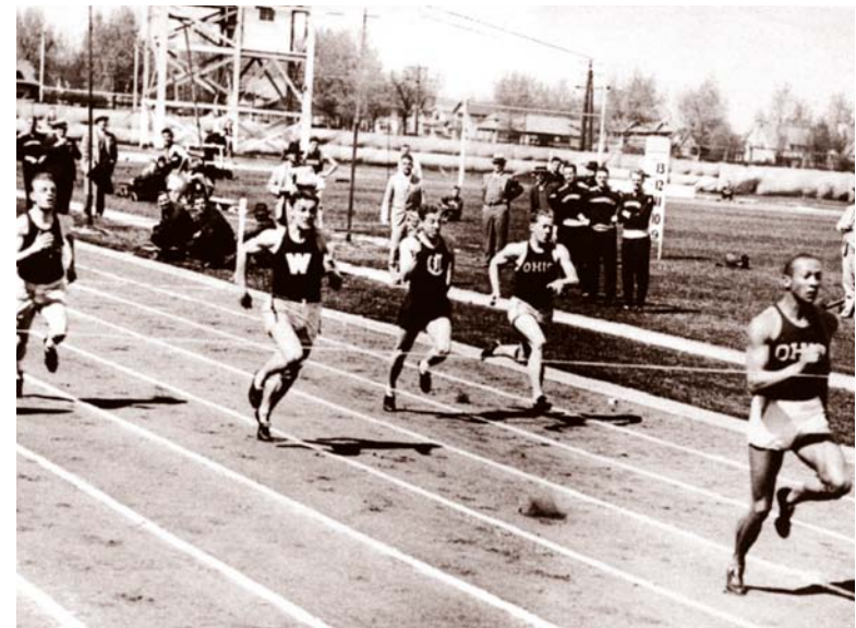
Jesse Owens a établi plusieurs records mondiaux et est devenu célèbre en tant que coureur étoile avant de participer aux Olympiques.

En 1972, des terroristes ont pris neuf athlètes olympiques d'Israël en otage. Dix-sept personnes ont été tuées. Aux Jeux de 1996, une bombe a tué une personne et en a blessé plus d'une centaine d'autres.