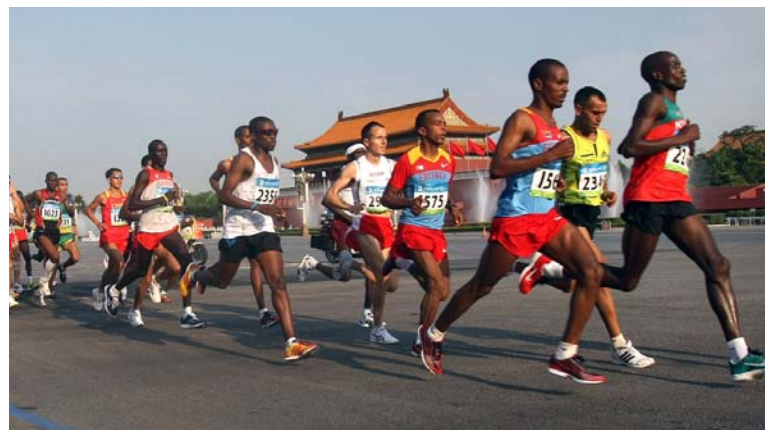
Des athlètes courent le marathon des hommes durant les Jeux d'été de 2008 à Beijing, en Chine.

La Grèce a accueilli les premiers Jeux Olympiques modernes en 1896. Des milliers de gens se sont rendus pour assister aux Jeux. Deux cents athlètes en provenance de quatorze pays ont participé. Les nouveaux Jeux ont été un vrai succès!