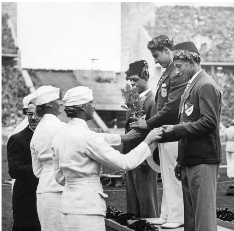
Les gagnants de l'haltérophilie chez les hommes reçoivent leur médaille aux Jeux de 1936 à Berlin, en Allemagne.

Le Comité International Olympique a décidé que les nouveaux Jeux Olympiques porteraient principalement sur la compétitivité pacifique et la passion pour les sports. En restant fidèle aux anciens Jeux, le CIO ne voulait pas que les athlètes participent pour de l'argent. Les champions allaient recevoir une médaille d'argent et une branche d'olivier. Les athlètes professionnels (payés) ne seraient pas autorisés à participer aux Jeux.