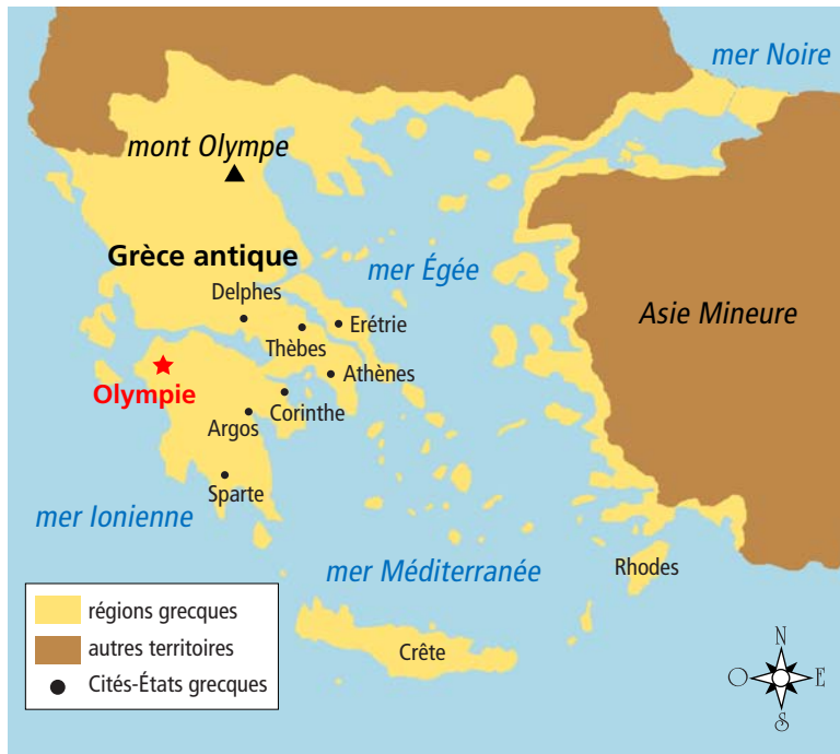
Carte de la Grèce antique à l'époque des premiers Jeux Olympiques