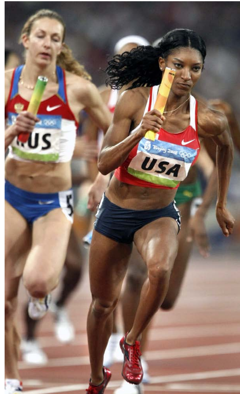
Monique Henderson a aidé son équipe à remporter la médaille d'or dans la course de relais 4 x 400 mètres lors des Jeux d'été de 2008.