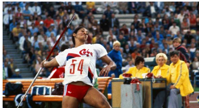
María Colón de Cuba effectue le lancer qui lui permettra de remporter la finale du lancer du javelot chez les femmes. Elle a établi un record mondial et olympique de 68,4 mètres le 25 juillet 1980.