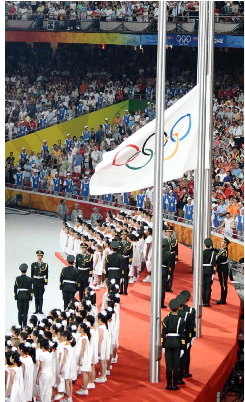
Le drapeau olympique est baissé lors de la cérémonie de fermeture des Jeux d'été de 2008 à Beijing, en Chine.

En 1920, le nouveau drapeau olympique a été utilisé pour plusieurs cérémonies. Les anneaux reliés sur le drapeau représentent les continents habités du monde travaillant ensemble de façon pacifique.