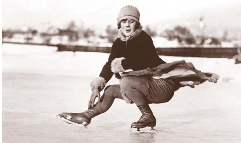
La patineuse norvégienne Sonja Henie

En 1928, les femmes ont officiellement commencé à participer aux compétitions des Jeux d'été. Après cela, la liste des disciplines pour les femmes a pris de l'ampleur chaque année.