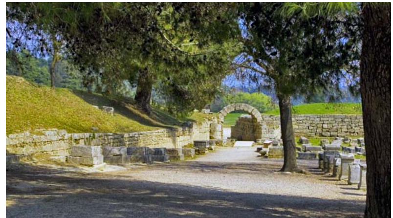
Les ruines de l'entrée du stade construit vers 200 av. J.-C. à Olympie, en Grèce

Un homme, qui vivait en France, s'est intéressé à la recherche d'Olympie. Il avait entendu parler des Jeux de l'Antiquité. Il aimait le fait qu'ils représentaient une compétitivité pacifique . Il voulait commencer une nouvelle compétition sportive mondiale. Il a formé le Comité International Olympique, ou CIO, en 1894.