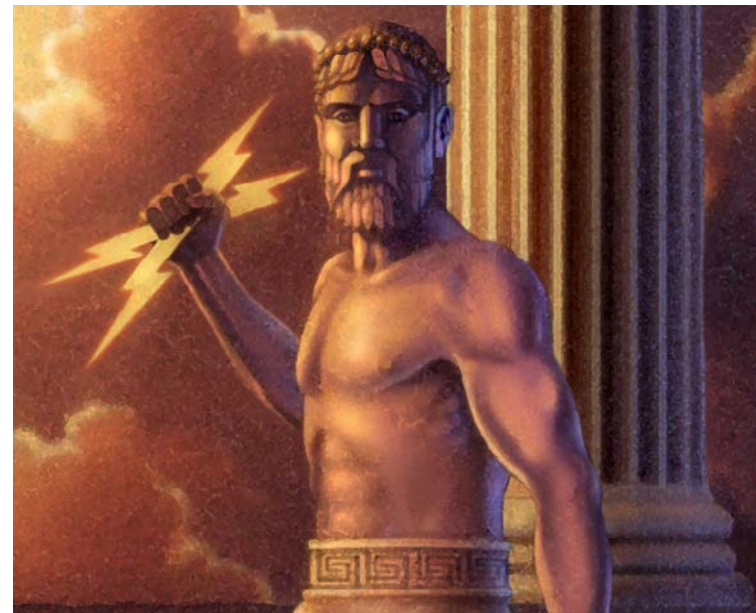
Pour les Grecs de l'Antiquité, Zeus était le dieu du ciel et du tonnerre. Il était souvent illustré tenant un éclair.

Plus important encore pour tous les Grecs, les Olympiques étaient une période de paix. Les Cités-États avaient convenu de ne jamais se battre durant les Jeux. Les gens se sentaient en sécurité pour voyager à travers la Grèce à chaque fois que des Olympiques avaient lieu.