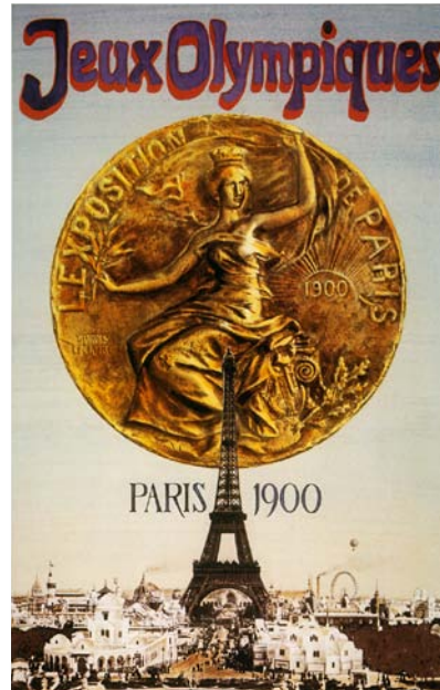
Une affiche des Jeux d'été de 1900 à Paris, en France

Les deux Jeux Olympiques suivants n'ont pas connu un aussi grand succès. Les athlètes vivaient dans de mauvaises conditions. Le mauvais temps a ruiné plusieurs événements. Les organisateurs ont tiré des leçons de leurs erreurs et les nouveaux Jeux Olympiques sont éventuellement devenus célèbres partout à travers le monde.