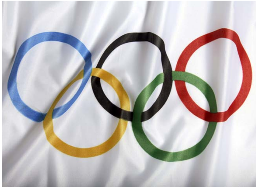
Le drapeau olympique

Les Olympiques coûtent beaucoup d'argent à organiser. Le CIO amasse de l'argent en vendant des produits en rapport avec les Olympiques. Plusieurs entreprises paient le CIO pour la permission de diffuser les Olympiques à la télévision. D'autres paient pour le droit de mettre le logo olympique sur leurs produits.