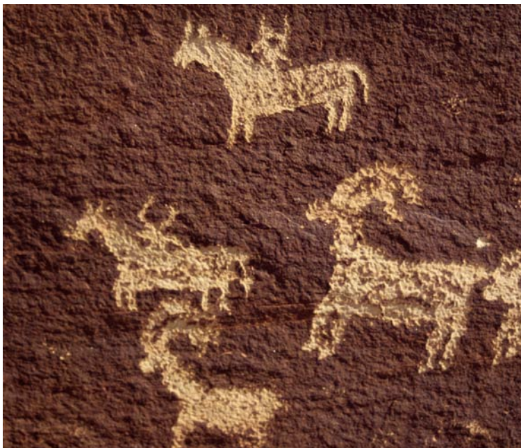
Une peinture rupestre