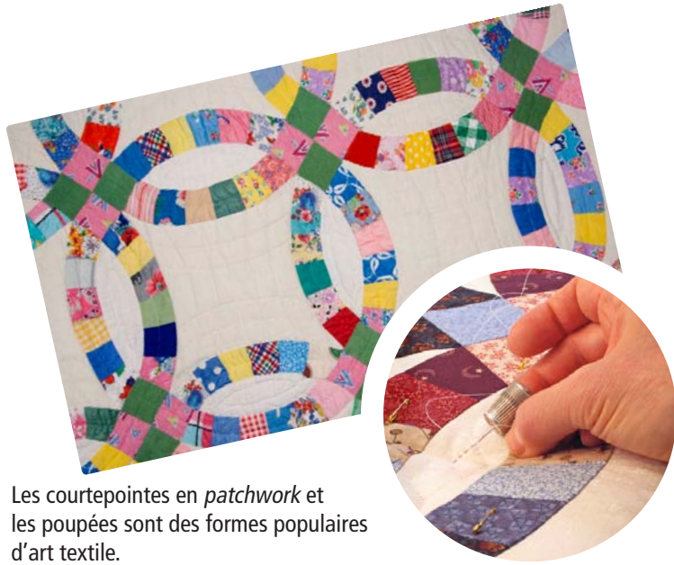
Les courtepointes en patchwork et les poupées sont des formes populaires d'art textile.

Les courtepointiers créent de l'art à partir de petits bouts de tissus. Ils les assemblent en les cousant pour en faire des courtepointes. Autrefois, acheter du tissu neuf coûtait cher. Les gens économisaient leur argent en récupérant des bouts de tissu pour confectionner leurs couvre-lits. Ils réalisaient des motifs magnifiques en assemblant de manières créatives les différents bouts.