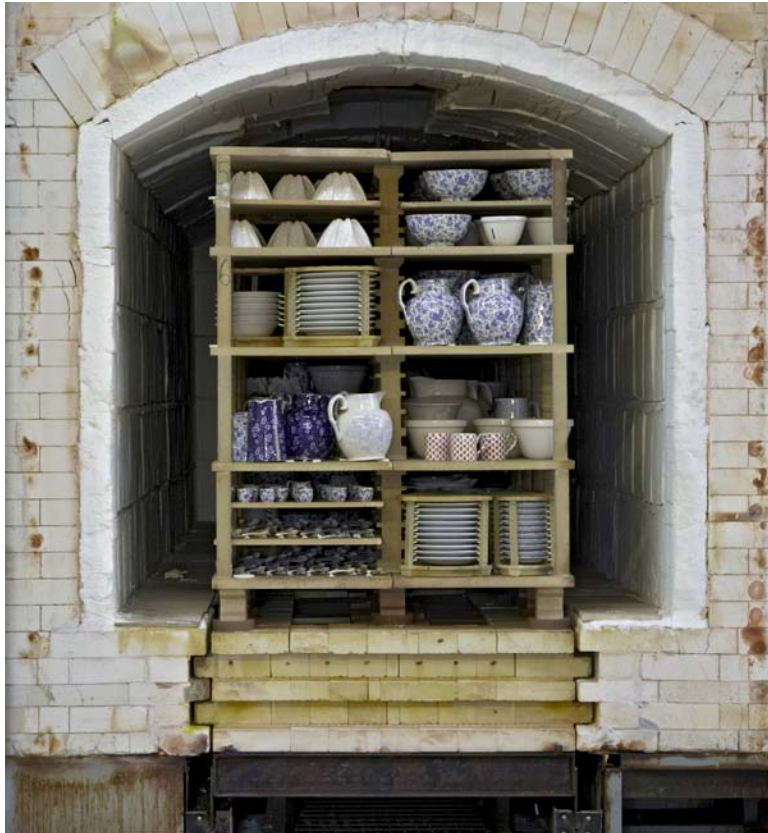
Des poteries en train d'être cuites

L'argile façonnée est cuite dans un four très chaud appelé four à céramique . La chaleur permet d'extraire toute l'humidité présente dans l'argile. L'argile cuite et sèche s'appelle de la céramique . Les potiers utilisent une peinture à céramique spéciale, appelée glaçure , pour donner à la céramique un aspect vernissé et rendre les couleurs vibrantes.