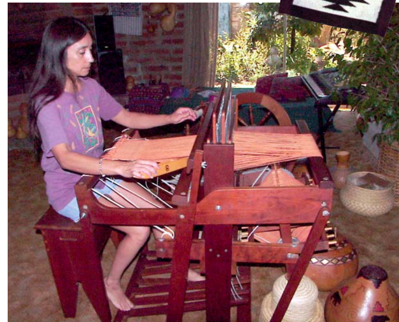
Un métier à tisser