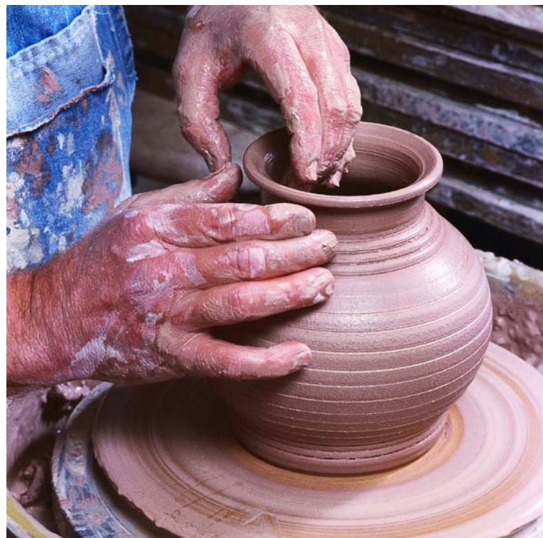
De la poterie en argile en train d'être façonnée

Les potiers créent de l'art avec de l'argile malléable et humide. Leur art s'appelle la poterie. Les potiers déposent une motte d'argile humide sur un tour de potier qui tourne très vite. Les potiers façonnent la motte d'argile de leurs mains en la pinçant, en la pressant et en l'étirant, jusqu'à lui donner la forme souhaitée.