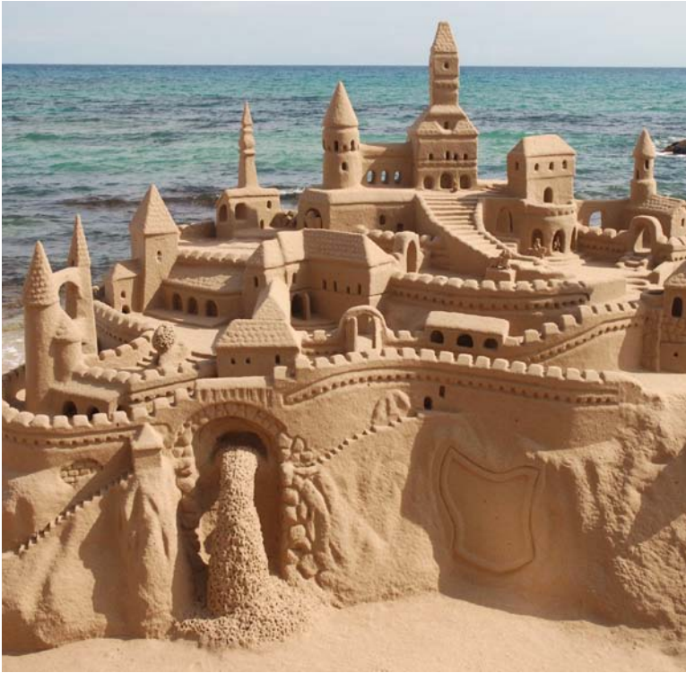
Beaucoup de châteaux de sable sont de véritables œuvres d'art.

De nombreux artistes aiment utiliser des objets naturels pour créer leurs œuvres d'art. Certains réalisent des formes immenses sur les plages avec des rochers et du sable. D'autres ramassent du bois flotté aux formes magnifiques pour réaliser des sculptures. D'autres artistes utilisent des branches, des pierres et des plantes pour créer des formes imaginatives dans un jardin ou un parc.