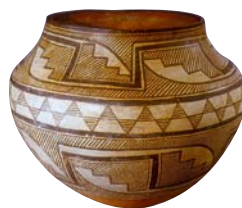
Une poterie Pueblo

Les plus anciennes œuvres d'art ont été peintes sur les parois des cavernes ou gravées sur des rochers. Ces dessins très simples nous apprennent comment était la vie il y a très longtemps. Les scientifiques qui fouillent les anciennes ruines découvrent des poteries, des fresques murales, des gravures, des mosaïques de sol, et bien d'autres œuvres réalisées par les premiers artistes.