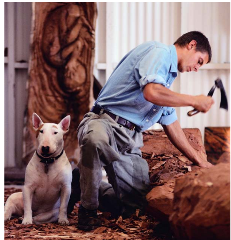
Un sculpteur sur bois

Certains sculpteurs utilisent des outils pointus pour sculpter des formes dans du bois, de la pierre, de la glace ou de la cire. D'autres réalisent des sculptures textiles . Ils tissent des tissus, des fils ou des bandes de cuir. Certains sculpteurs coulent des formes et des statues en métal.