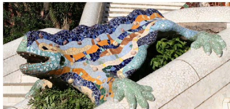
(en haut) Un musée d'art