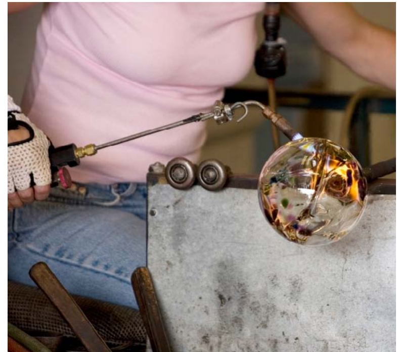
Une souffleuse de verre façonne une boule de verre.

Le verre est gluant quand il est en fusion, comme un sirop épais. Les souffleurs de verre prennent une goutte de verre chaud avec l'extrémité d'un tube de métal long et creux appelé une canne à souffler . Ils soufflent de l'air à travers le tube pour créer une bulle de verre. Tant que le verre est chaud, ils peuvent faire pivoter ou vriller la bulle. Ils peuvent la faire aussi large, longue, mince ou haute qu'ils le souhaitent.