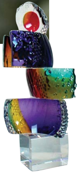
Une sculpture de verre

Les souffleurs de verre travaillent très rapidement mais ils doivent faire très attention. Quand le verre se refroidit, il peut se briser facilement.