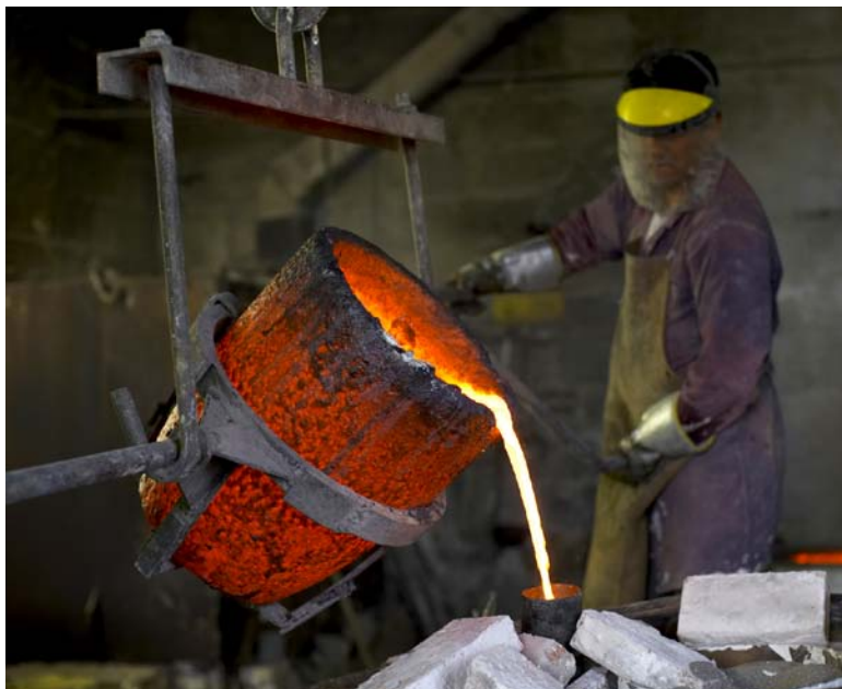
Une sculpture coulée dans du bronze

Pour couler une sculpture de métal, les sculpteurs doivent d'abord sculpter un modèle en argile. Ensuite, ils recouvrent ce modèle en argile de plâtre humide, qui sèche et puis durcit—comme le plâtre d'un bras cassé—pour devenir un moule. Ensuite, ils versent le métal chaud et liquide dans le moule en plâtre durci. Le métal liquide refroidit et durcit. Les sculpteurs retirent ensuite le moule en plâtre de la sculpture. Ils peuvent maintenant polir leur œuvre d'art.