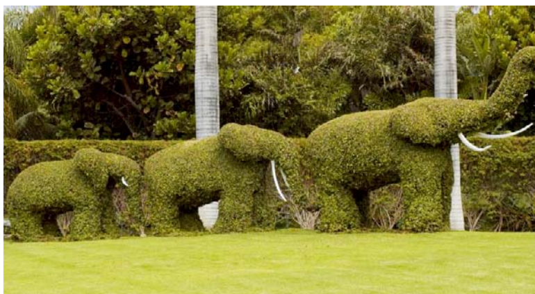
(en haut) Une murale représentant un phare crée une illusion intéressante. (en bas) Ces sculptures d'éléphants ajoutent un côté amusant au parc.

Cherche l'art autour de toi. Il est partout. Déniche les sculptures en plein air dans les parcs et les murales que tu peux voir quand tu te promènes à pied ou à vélo.