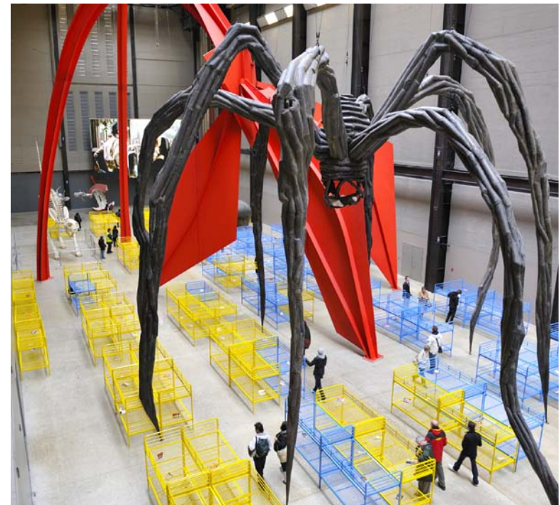
Une installation nécessite une pièce entière pour réaliser une œuvre d'art.

Les installations artistiques sont des pièces entières ou des bâtiments entiers qui ont été transformés en œuvres d'art. L'artiste remplit la pièce d'objets, de couleurs, de formes, de sons et de lumières pour créer une ambiance spéciale. Les artistes qui réalisent ces installations veulent que tu te promènes à l'intérieur. Ils veulent que tu regardes et que tu touches les différents éléments de cette œuvre à la dimension d'une pièce.