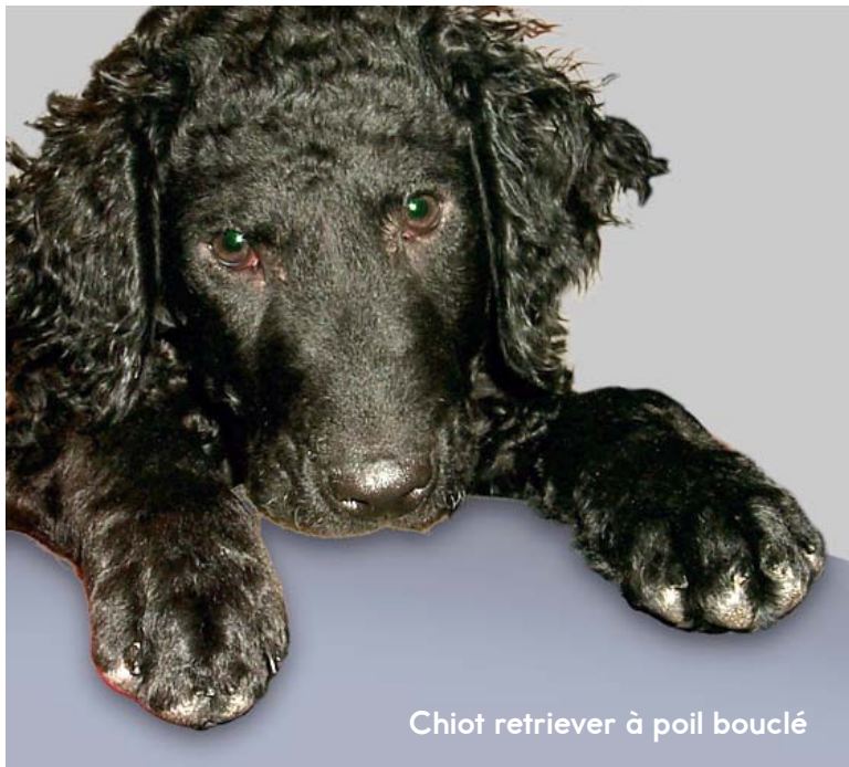
Chiot retriever à poil bouclé