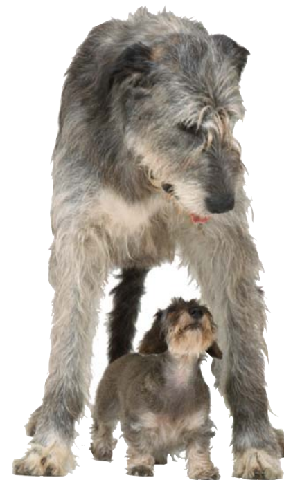
Un lévrier irlandais et un ami terrier

Le lévrier irlandais est un des plus grands chiens au monde. Il peut mesurer jusqu'à 0,9 mètres (3 pieds) du sol au niveau des épaules. Il a été élevé pour chasser et tuer les loups. Il a de longues pattes puissantes qui font de lui un chasseur rapide.