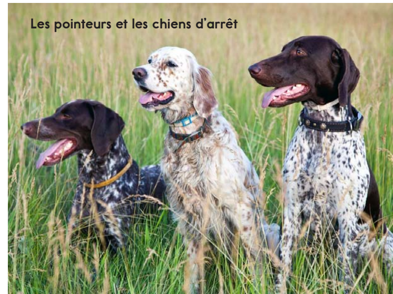
Les pointeurs et les chiens d'arrêt

Les chiens de sport ont été élevés pour aider les chasseurs. Certains chiens de sport aident les chasseurs à trouver le gibier – l'animal que l'on chasse. D'autres chiens de sport trouvent le gibier qui a été abattu et le rapporte au chasseur.