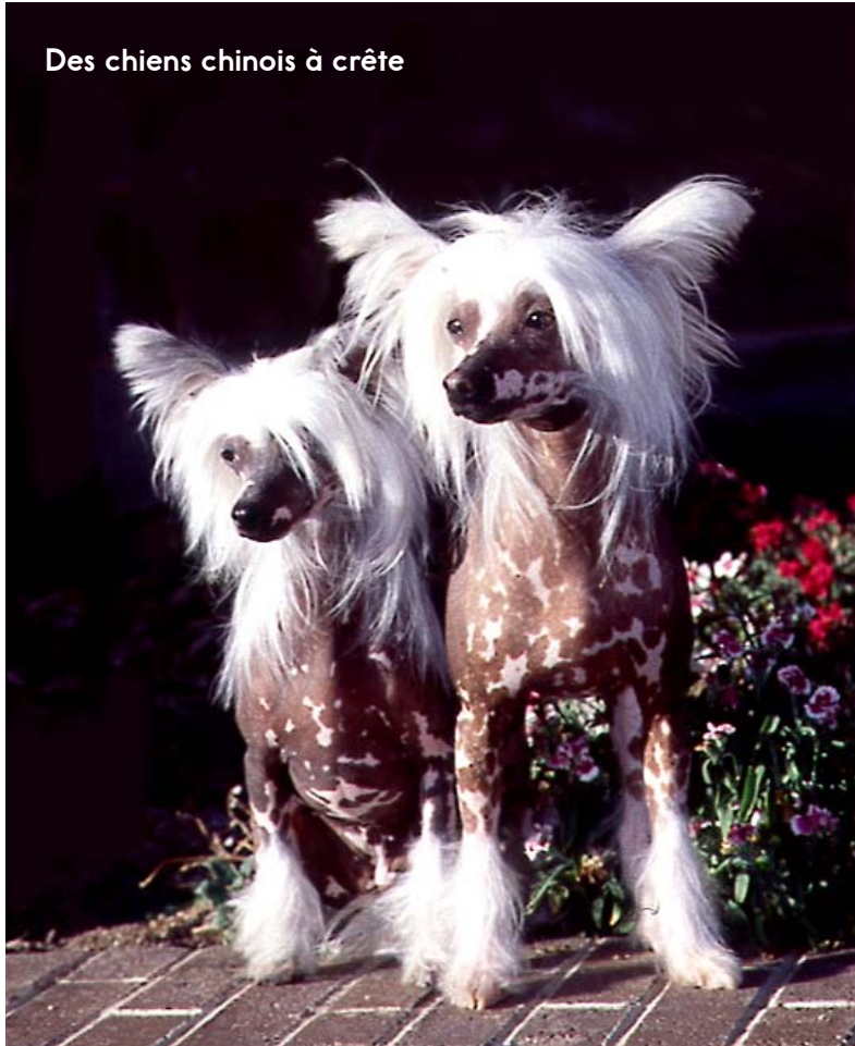
Des chiens chinois à crête

Le chien chinois à crête est chauve à l'exception de quelques touffes de poils sur la tête et les pattes. Sa peau est gris foncé avec des taches roses. Il a besoin de lotion solaire l'été. L'hiver, il a besoin de porter un manteau pour rester au chaud.