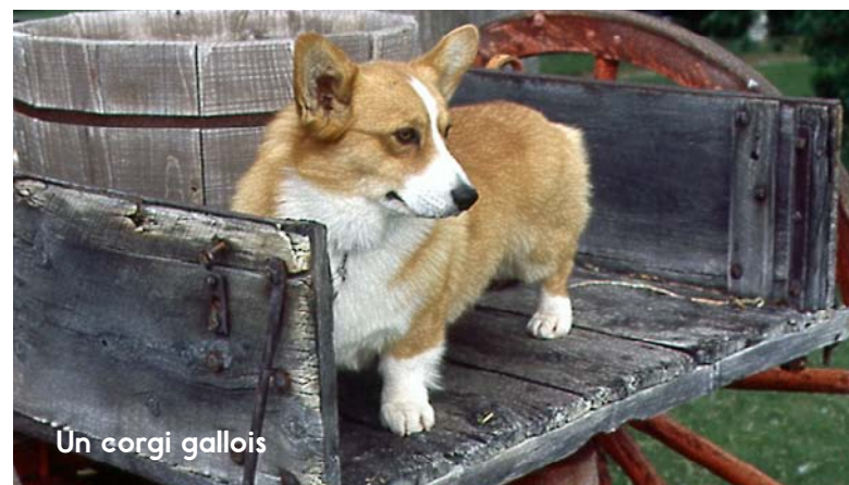
Un corgi gallois

Les chiens de berger sont rapides et intelligents. Ils ont été élevés pour contrôler d'autres animaux comme des moutons ou du bétail. Les chiens de berger contrôlent les animaux en jappant, en les fixant du regard ou en les mordillant. Les chiens de berger sont faciles à dresser. Ce sont des travailleurs indépendants et acharnés.