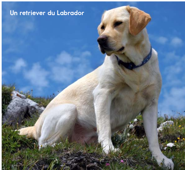
Un retriever du Labrador

Le retriever du Labrador, ou le labrador, est un chien de sport populaire qui est également un bon chien de famille. Il a d'abord été élevé pour rapporter des oiseaux abattus lorsqu'ils tombaient dans un étang ou un lac. Les labradors ont des pieds palmés qui les aident à bien nager. Leur pelage imperméable les garde au chaud dans l'eau froide. Ils ont une mâchoire puissante pour transporter de gros oiseaux.