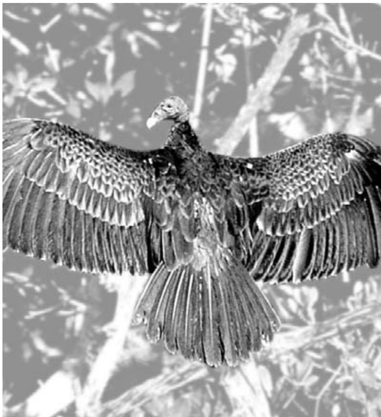
Un vautour Aura

Le vautour Aura de l'Amérique du Nord, de l'Amérique centrale et de l'Amérique du Sud aide les gens. Il se débarrasse des carcasses d'animaux et ceci empêche les maladies de se répandre. Son sens de l'odorat est tellement bien développé que le vautour Aura a été utilisé pour aider les gens à localiser des fuites de gaz.