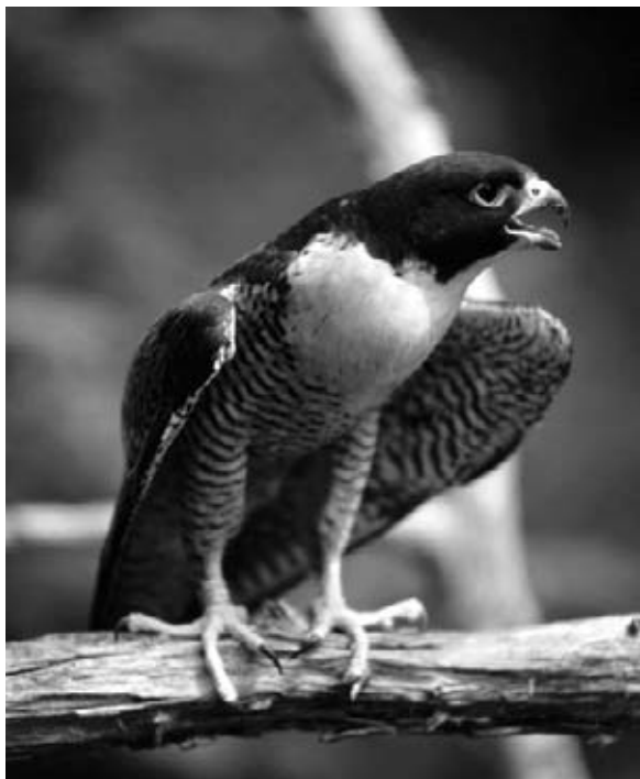
Un faucon pèlerin