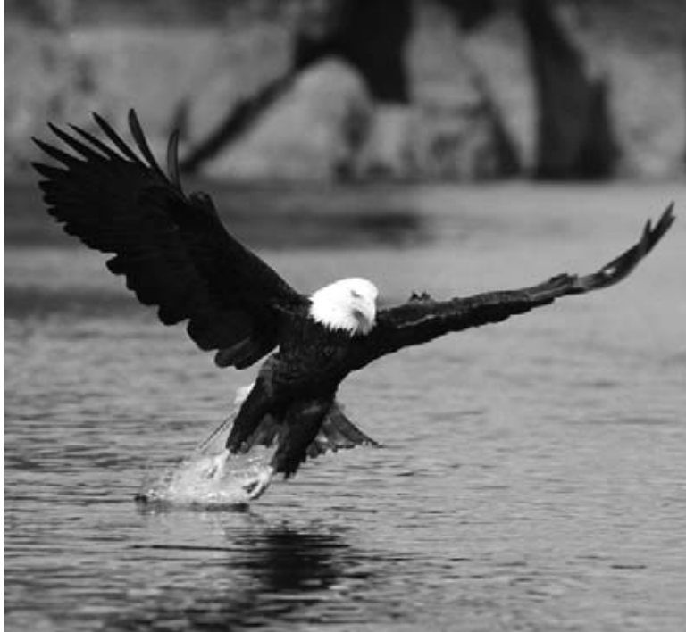
Un aigle à tête blanche