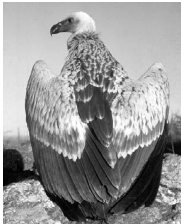
Un vautour chassefiente

Les faucons volent rapidement. Le faucon pèlerin vit dans des paysages qui varient de la toundra arctique à la forêt tropicale. Il est un des oiseaux de proie qui vole le plus vite. Quand il descend en piqué, il peut atteindre une vitesse de 322 kilomètres à l'heure. Le faucon pèlerin mange habituellement ses proies attrapées en plein vol.