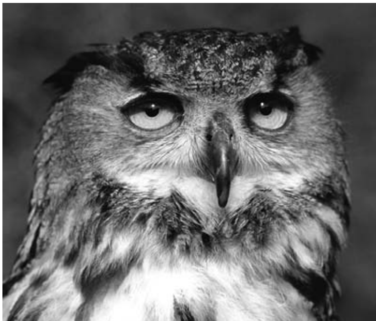
Un Grand-duc d'Europe