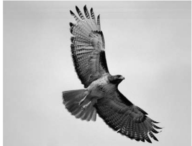
Une buse à queue rouge