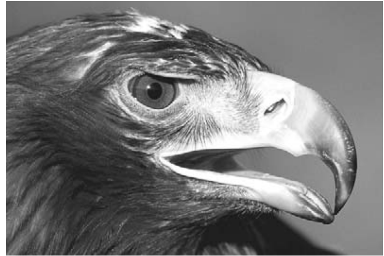
Un aigle royal

Les oiseaux dans la famille des falconiformes sont différents des hiboux. Les falconiformes chassent la journée, alors ils n'ont pas besoin de gros yeux ni de plumes silencieuses comme les hiboux. Ils ont plutôt besoin de vitesse, alors leur forme est plus aérodynamique.