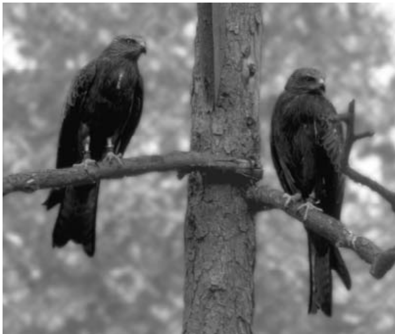
Des milans noirs.