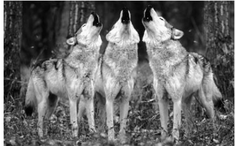
Les loups hurlent pour plusieurs raisons, pas seulement à la pleine Lune.