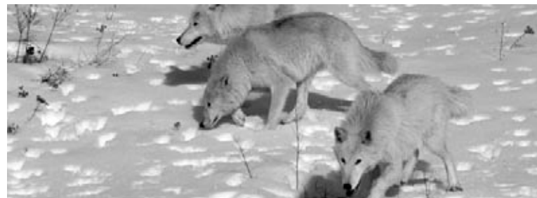
Une meute de loups surveille les animaux qui entrent dans leur territoire.

Les loups gris ne sont pas seulement gris. Leur épaisse fourrure chaude peut varier de beige à blanc pure. Les loups ont de larges pattes qui les aident à marcher sur la neige.