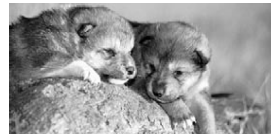
Des louveteaux gris à l'extérieur de leur tanière

Au printemps, la louve alpha creuse un long tunnel avec une tanière au bout. À l'abri dans la tanière, elle donne naissance à environ 6 à 8 louveteaux. Les louveteaux viennent au monde aveugles et sourds et ils pèsent environ autant qu'une boîte de soupe en conserve.