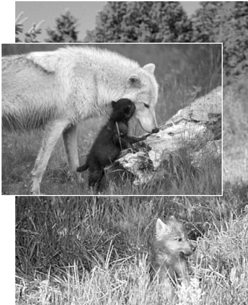
Les louveteaux passent beaucoup de temps à jouer avec d'autres membres de la meute.

Les louveteaux sont allaités pendant environ deux mois. Puis, ils se délectent des repas de viande chauds que les parents régurgitent pour eux.