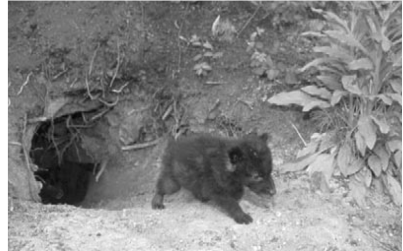
Un louveteau à l'entrée de la tanière