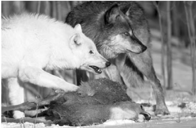
Le loup blanc utilise la position de son corps pour communiquer tout en se tenant au-dessus de sa proie.

Les membres de la meute utilisent la position de leurs oreilles, de leurs gueules et de leurs queues pour communiquer. Ils utilisent aussi des jappements, des gémissements et des hurlements. Les loups se sentent et se lèchent aussi les uns les autres.