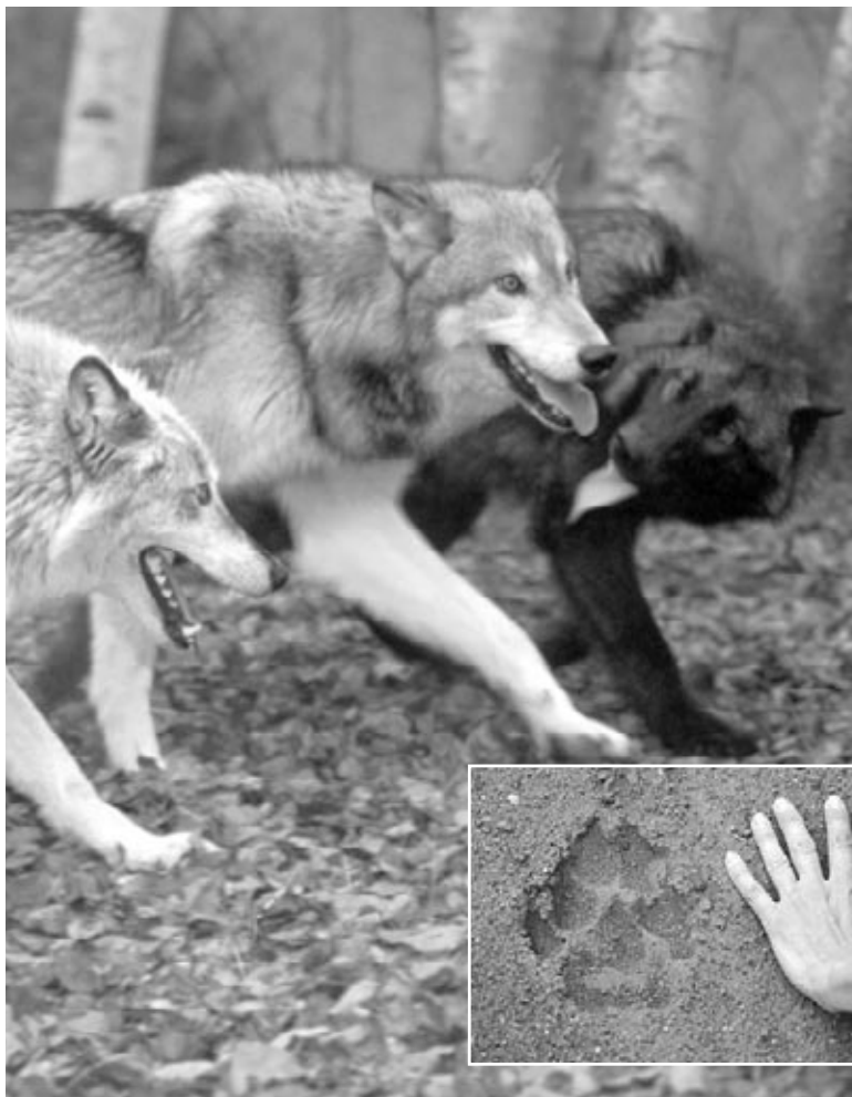
Le loup noir dans la meute

Les loups gris ne sont pas seulement gris. Leur épaisse fourrure chaude peut varier de beige à blanc pure. Les loups ont de larges pattes qui les aident à marcher sur la neige.