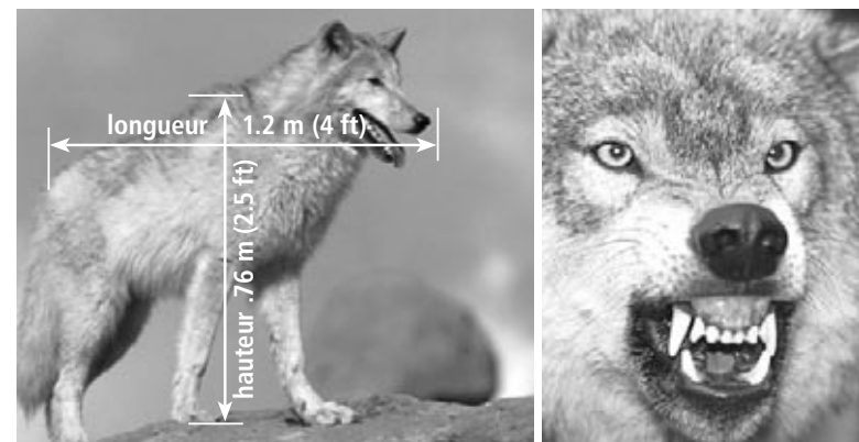
Les loups gris sont de gros animaux aux mâchoires puissantes.

Les loups ont des mâchoires extrêmement puissantes. La mâchoire d'un loup est six fois plus puissante que celle d'un humain et deux fois plus puissante que celle d'un gros chien.