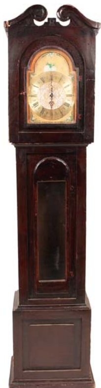
une horloge grand-père