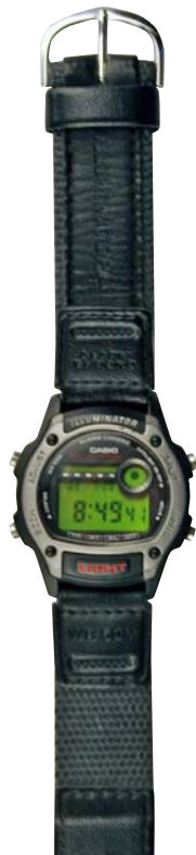
une montre numérique