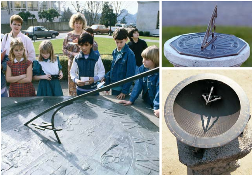
Grâce aux cadrans solaires, il était possible de lire l'heure de façon plus précise.

Malheureusement, les cadrans solaires ne pouvaient pas indiquer l'heure lorsque le temps était nuageux ou durant la nuit.