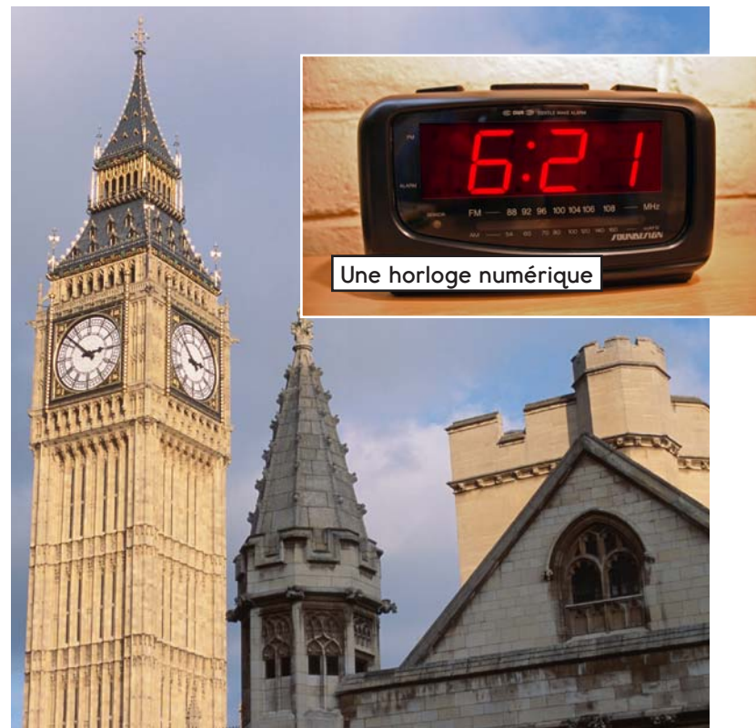
Une horloge numérique

Aujourd'hui, il y a toutes sortes d'appareils horaires, de la grande horloge grand-père aux montres que nous portons au poignet. La plupart des montres fonctionnent à l'électricité, qui est fournie par des piles.