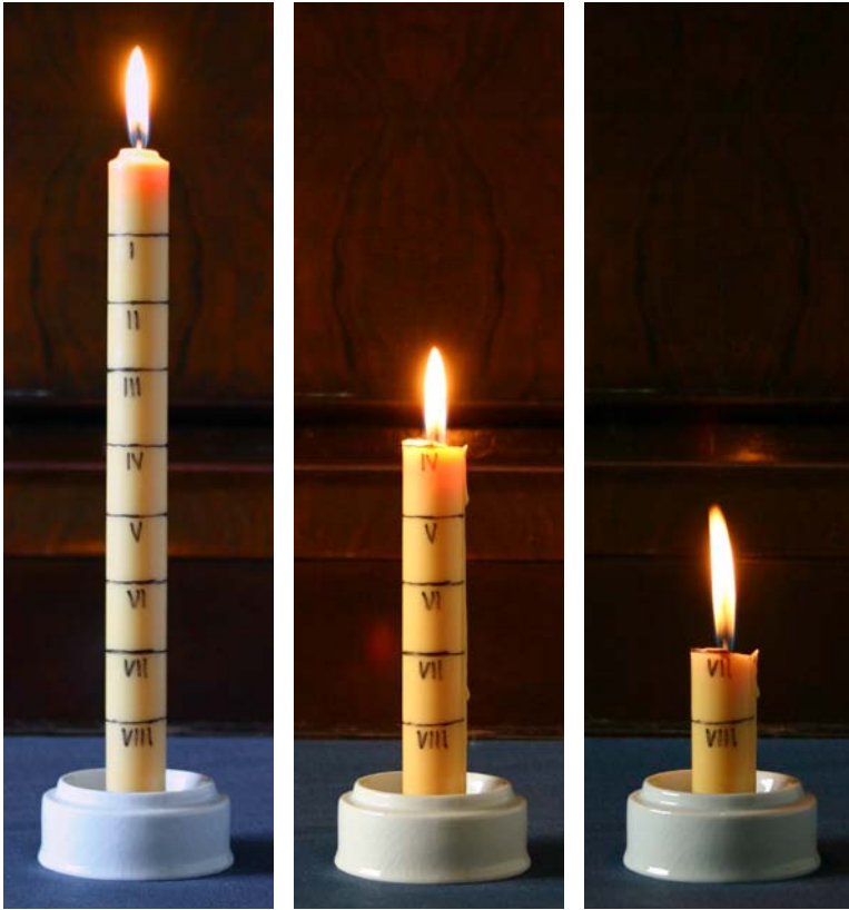
Des chandelles étaient utilisées pour indiquer l'heure après le coucher du soleil.

Une autre sorte d'horloge qui n'avait pas besoin du soleil était une horloge à chandelle . Il était possible de dire l'heure en fonction de la portion de la chandelle qui avait fondu. La chandelle portait des repères sur le côté pour indiquer les heures.