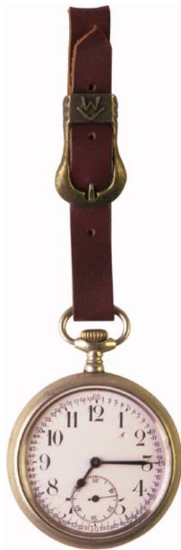
une montre de poche