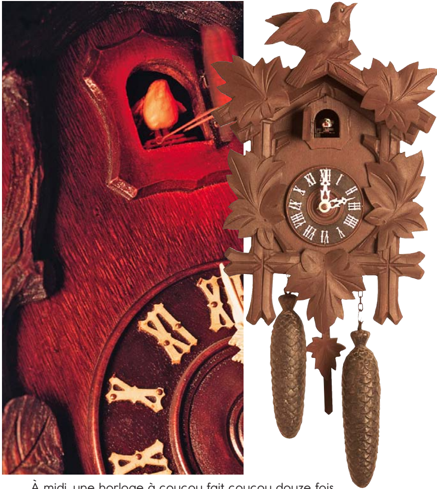
À midi, une horloge à coucou fait coucou douze fois.

À l'intérieur d'une sorte d'horloge analogique, il y a un oiseau sculpté appelé un coucou . À chaque heure, les portes s'ouvrent et l'oiseau sort et chante sa chanson : « coucou, coucou, coucou ! »