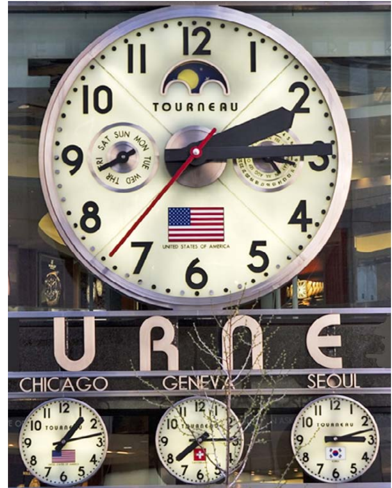
Ces horloges indiquent l'heure dans plusieurs villes autour du monde.